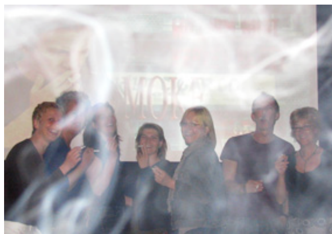
Heerlijk, dat laatste sigaretje tijdens Smoke (27 juni)

En met een fris gemoed verliet ik het pand van de 'boze' buurman om me beneden te voegen bij de verstokte rokers die met z'n alle zaten te genieten van hun laatste openbare rookavond met de film 'Smoke'. Ik heb 's avonds nog wel even de ramen opengezet. ME