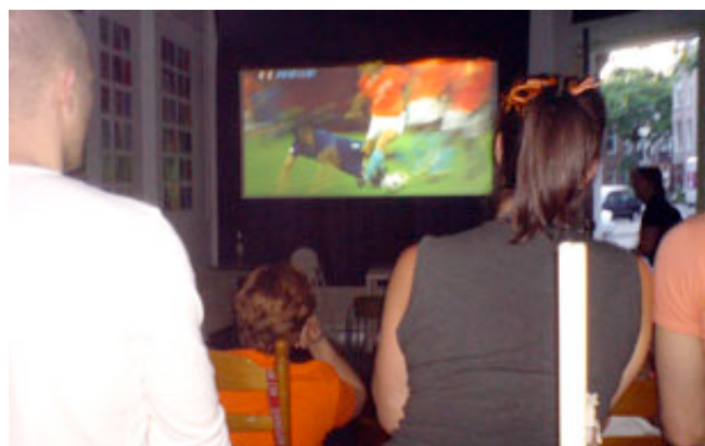
Nederland-Italië: 3-0 (op groot beeld bij Floris)

Mooi was die tijd. Monsterzeges op Italië en Frankrijk. Zelfs de Graaf Florisstraat was volledig in de ban van Oranje tijdens het Euro 2008. Helaas was het feest te snel voorbij weer. Een paar foto's voor de nostalgie.