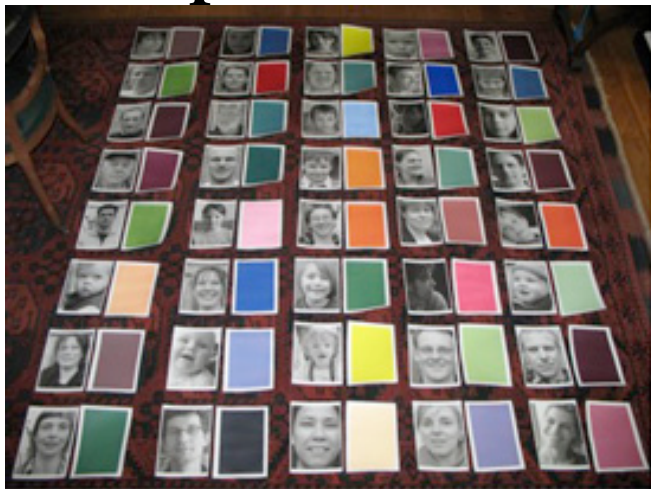
Expositie te bewonderen tot einde zomer in 88a