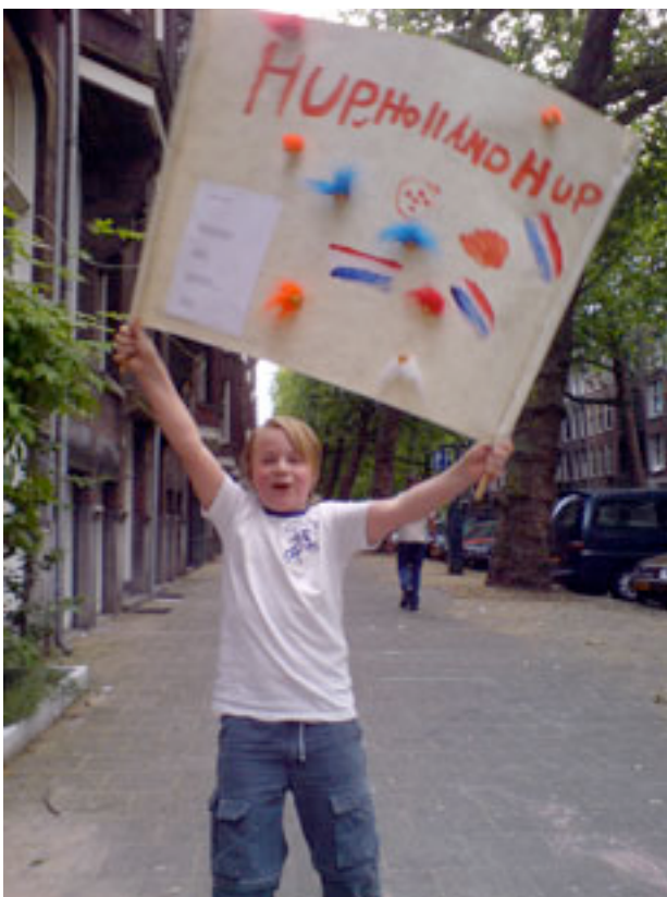
Alle hooligans verzamelen!

jaargang 3 – editie 3 – zomer 2008 – gratis voor bewoners via: info@graafflorisstraat.nl