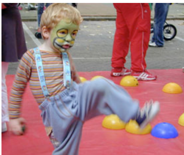
Schmink, skelteren en circusacts