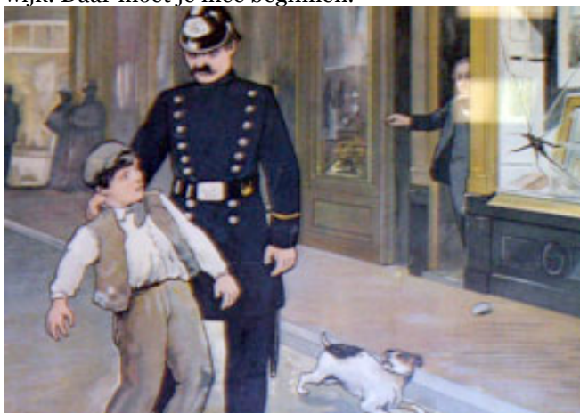
Bij de jeugd moet je beginnen

Nou door zichtbaar te zijn en als spin in het web te fungeren tussen de burgers, recherche en hulpdiensten ben je het sociale gezicht van de wijk. Dat vindt ik het belangrijkste en ook het leukste van mijn werk. We hanteren een zero-tolerance beleid in de wijk en treden repressief op. Dit heeft effect want in de afgelopen zeven jaar dat ik hier werk gaat het duidelijk beter in de wijk. De jeugd heeft ook de hoogste prioriteit in de wijk. Daar moet je mee beginnen.