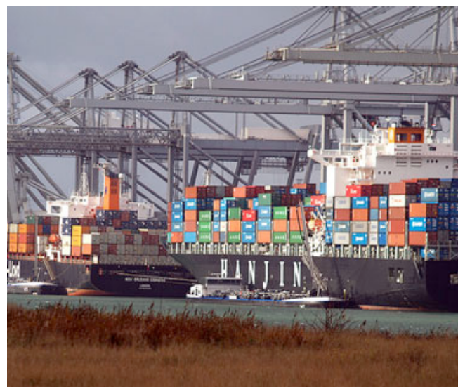
Dagtocht van Graaf Florisstraat naar de Rotterdamse Haven op 1 september: ga je mee?

De kosten zijn tussen de 15 en 20 euro p.p. voor de busrit en een drankje onderweg. Iedereen kan zich opgeven (jong tot oud). Doe dat via een mailtje naar info@graafflorisstraat.nl . Wees er snel bij want er kunnen ongeveer 45 mensen mee in de bus. JvW