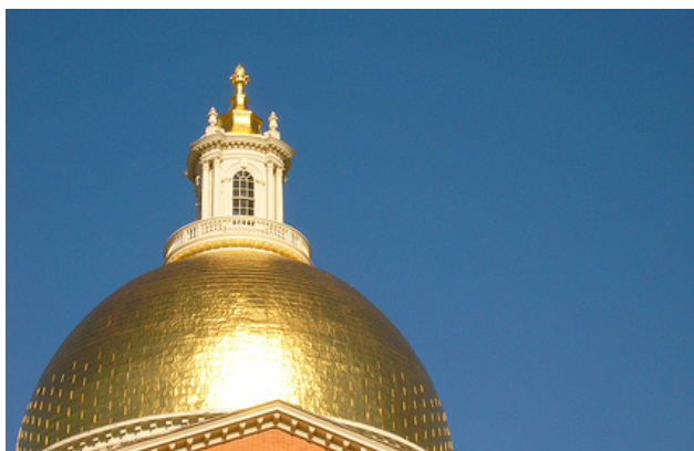
Graaf Floris: goudkust van Rotterdam!