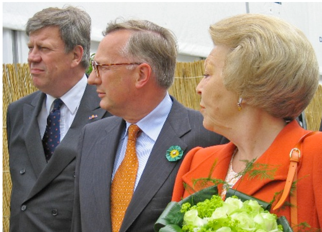
Opstelten: komt ie alleen?

aankondigen. Wie weet krijgen we dan alsnog de titel “culturele hoofdstraat van Rotterdam”. Meer over het spektakelstuk en vooral ook hoe ú hier aan kunt deelnemen, volgt in de volgende edities van de TeleGraafFloris. JB