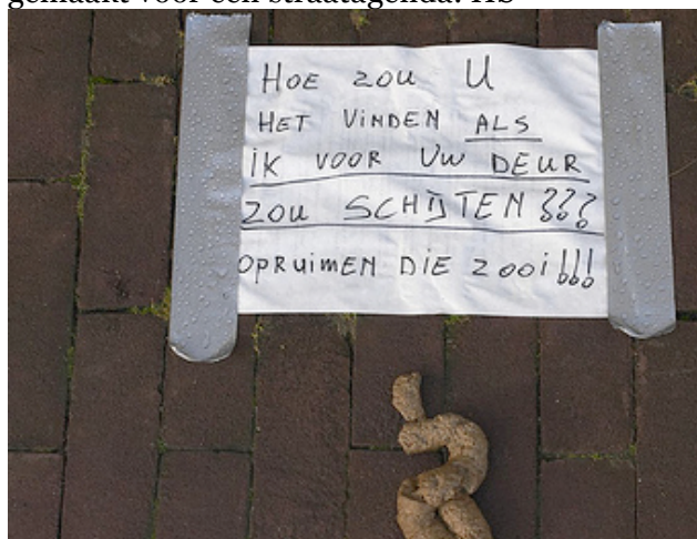
Grote ergernis straatbewoners

Onder het genot van lekker eten bij Gheestige Willem zijn eind mei deze resultaten besproken met de geïnterviewden. Ook is toen een opzet gemaakt voor een straatagenda. HS