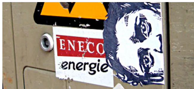
Eneco: geen nieuws / even geduld aub