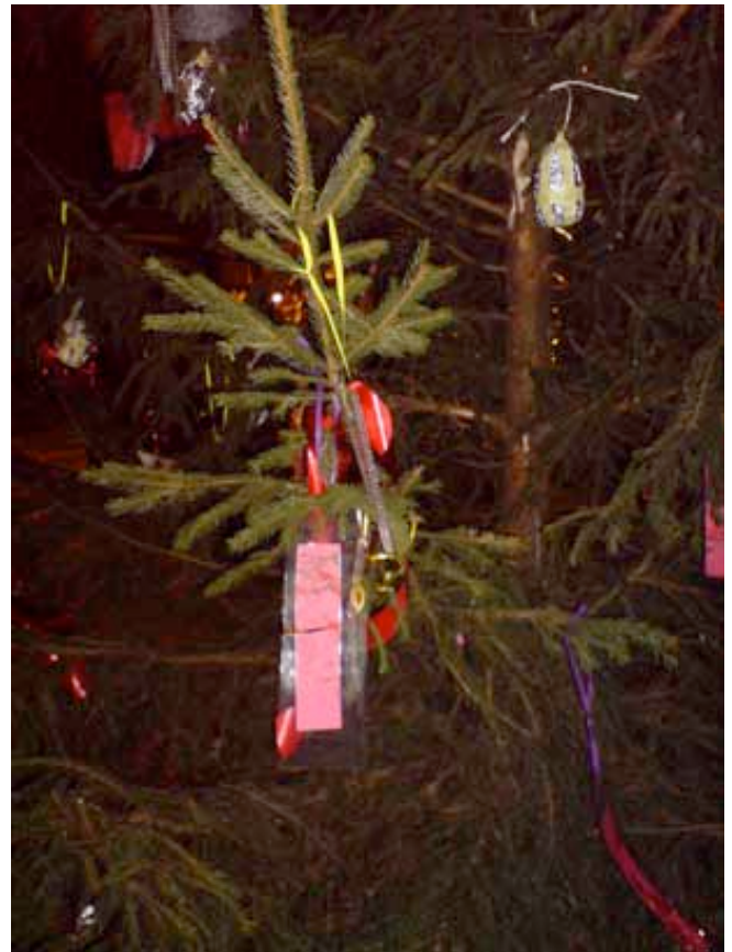
Kerstboom in volle glorie tijdens de kerstborrel

jaar dus kwijt. De bomen in de zijstraten, waar lichtjes in zaten, zijn ongemoeid gelaten. De dieven hebben het dus speciaal op onze mooie boom gemunt gehad. Maar... 'ieder nadeel heb ze voordeel': komend jaar weer zo'n leuke middag om versieringen te maken. FH