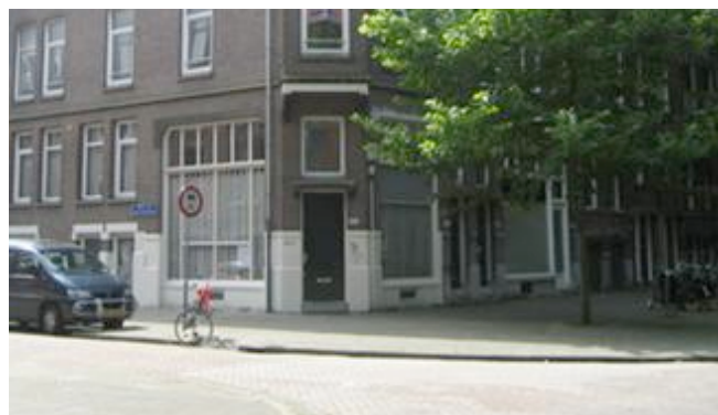
88 tientjesleden dragen vaste lasten 88a

De uitkomst van de enquête leidde tot het voorstel van het bestuur van de vereniging om de huur en de energiekosten van 88a volledig te financieren door tientjesleden. Er zijn dan geen commerciële activiteiten nodig, waardoor er volop ruimte is voor verenigingsactiviteiten. Met het maximum aantal van 88 huishoudens dat lid kan worden, is er voor alle leden ruimte om ook voor een privé activiteit van het pand gebruik te maken. Lid worden? Kijk dan op www.graafflorisstraat.nl . Wacht niet te lang, want vol = vol. JB