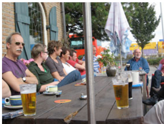
Versnaperingen mochten niet ontbreken