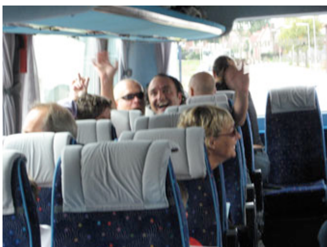
Ook florisstraatbewoners zijn net kinderen